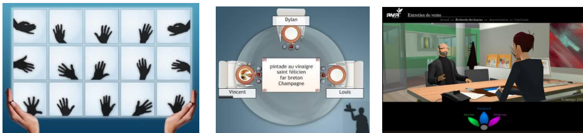
Figure 2 : Exemples de composants pédagogiques

La figure 2 montre trois composants : les deux de gauche sont des minis jeux de vitesse et de travail de l'attention et de la mémoire (HAPPYneuron 4 ) et le troisième est un composant de mise en situation professionnelle (Daesign 5 ).