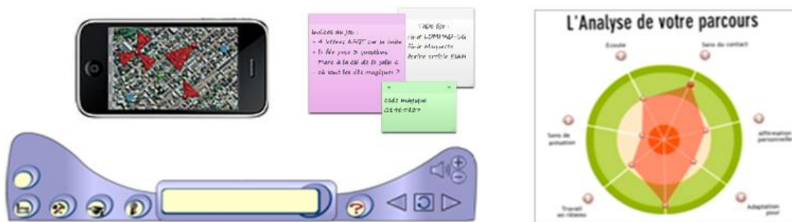
Figure 3 : Exemples de composants fonctionnels